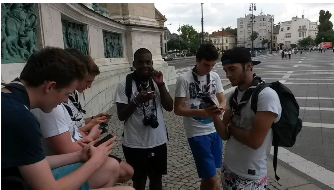
Les pis à la recherche de Pokémons