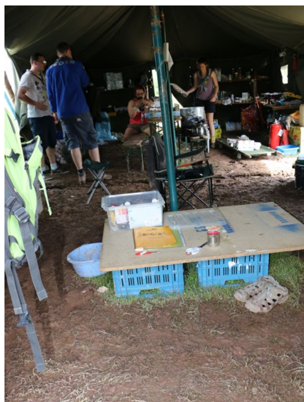
L'intendance et/ou champ de boue couvert de la Rangers (observez la tranchée au milieu...)