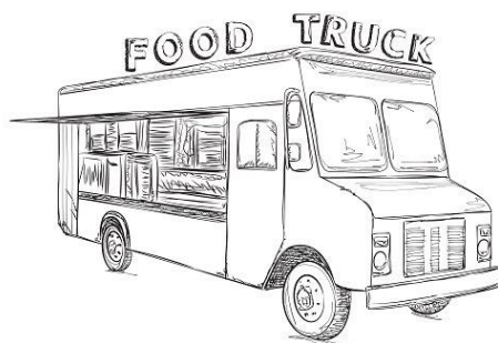
Restauration Sympa !